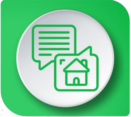
Construcción Narrativa Gremial / Sectorial