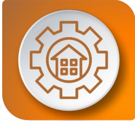
Destruir - Habilitar - Facilitar