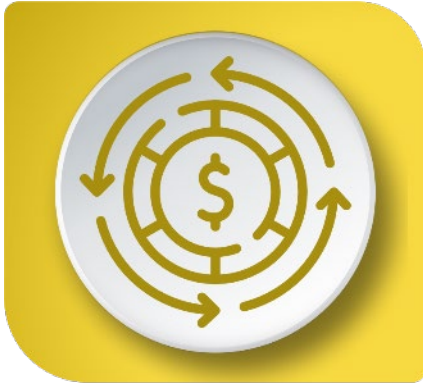
Sostenibilidad Financiera y Operacional