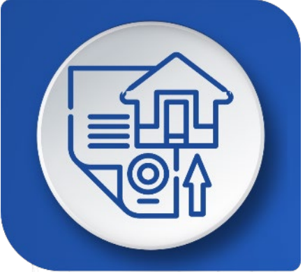
Aumentar el licenciamiento /Oferta de proyectos