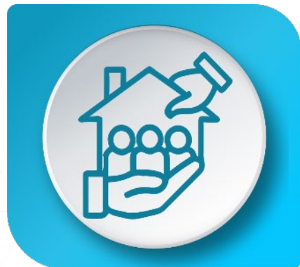
Ejecución política vivienda distrital / Departamental