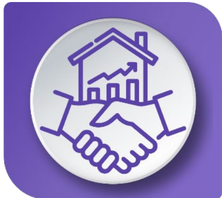
Afiliados cantidad / Calidad oferta de valor