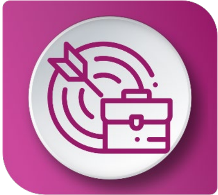
Nuevos negocios /Oportunidades