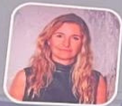
Nicole Solé Inmobiliaria Exxacon